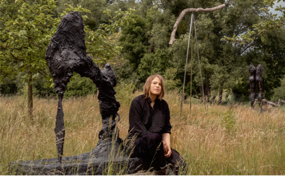
Die Künstlerin mit ihrer Arbeit die Taube (without), 2017/2018 Bronze 160 x 152 x 70 cm