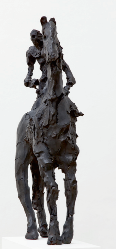
Titelabbildung: à travers la tête, 2017 Bronze, patiniert 235 x 86 x 89 cm

Führungen / Guided tours Öffentliche Themenführung Stella Hamberg – 16. Robert Jacobsen Preis Dauer 60 Minuten, 6 Euro pro Person Freitag, 24.7., 16 Uhr Weitere Informationen und Anmeldung unter www.KunstKultur.wuerth.com