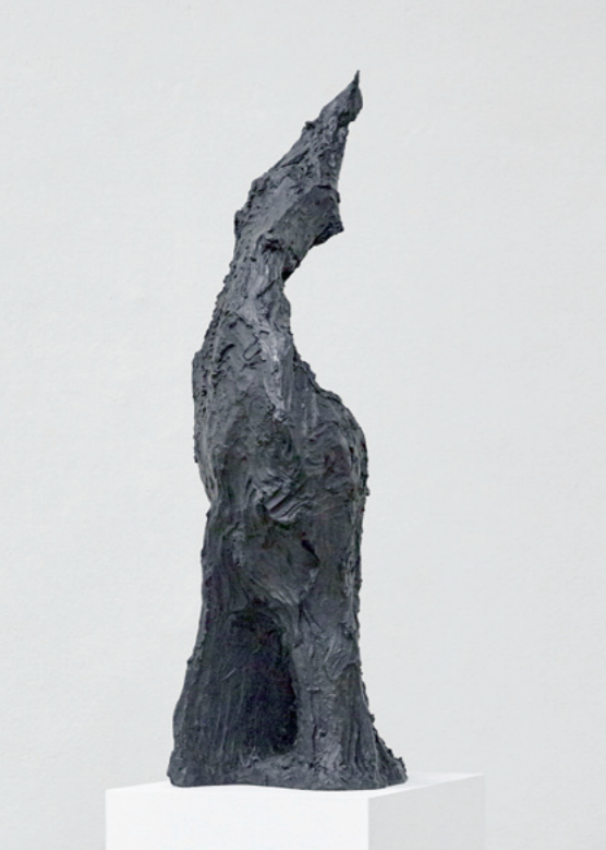
raus aus Babylon (das subjektive Ich), 2017/2018 Bronze 144 × 54 × 42 cm