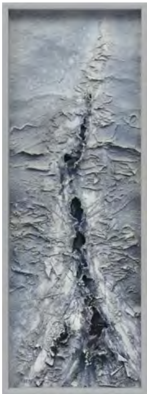
Gertrude Reum Aufbrüche, 1995 Zellstoffrelief, 120 x 41,5 cm Sammlung Würth, Inv. 3869

Gertrude Reum hat immer wieder nach neuen Materialien Ausschau gehalten und mit ihnen experimentiert, auch wenn sie ungewöhnlich oder anspruchsvoll waren. Wie unterscheiden sich die genutzten Materialien in ihrer Wirkung und ihren Eigenschaften? Welche Bearbeitungsprozesse entwickelte sie für welche Materialien? Aus nächster Nähe vergleichen wir die Werkstoffe der Künstlerin.