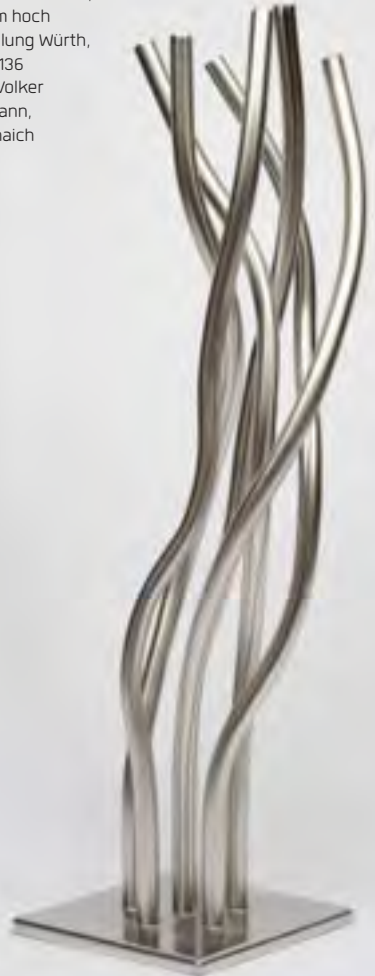
Gertrude Reum Aufwärts, 2011 Chromnickelstahl, 150 cm hoch Sammlung Würth, Inv. 17136

Nur 500 Meter Fußweg entfernt befindet sich unser Skulpturengarten. Nach dem Ausstellungsbesuch bietet der Garten die Möglichkeit zur Vesperpause und Bewegung an der frischen Luft.